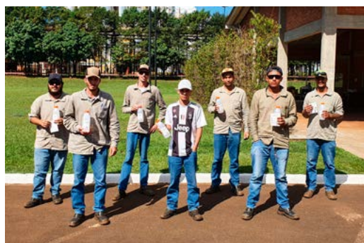
Funcionários, da Usina Buriti, recebendo o álcool 70%