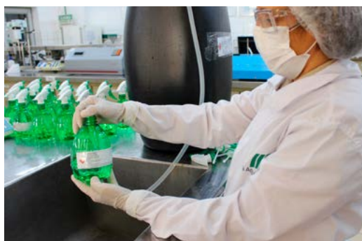
Envasamento de álcool 70%, na Usina da Pedra para distribuição em todos os setores e equipamentos agrícolas

Todas as medidas protetivas e preventivas têm como finalidade contribuir ao máximo para evitar a disseminação do vírus e minizar os impactos sociais nas comunidades. Porém, a conscientização, união e integração de todos em busca desse único propósito é essencial. O esforço de cada pessoa, em particular, e da comunidade, como um todo, é fundamental para conter a dispersão da COVID-19. Faça a sua parte!