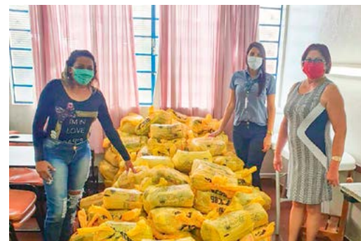
Doação de cestas básicas em Igarapava/SP, promovida pela Usina Buriti

Nota de esclarecimento: A empresa ressalta que, nessa edição do Jornal Observador, todas as fotos de grupos com pessoas sem a utilização de máscaras foram registradas antes da definição do regulamento interno da Pedra Agroindustrial, baseado nas orientações do Ministério da Saúde e Decreto Estadual, que determina o uso obrigatório de máscaras como medida preventiva a transmissão do Coronavírus (COVID-19).