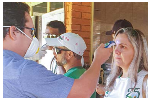
Medição de temperatura de funcionário, na Usina Buriti