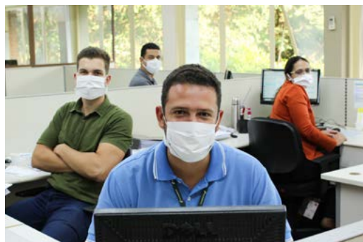
Funcionários, da Usina da Pedra, utilizando máscaras, em conformidade com a obrigatoriedade do uso nas dependências da empresa