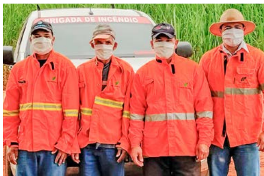
A Brigada de Incêndio, da Usina Buriti, seguindo a orientação da utilização de máscaras também no campo