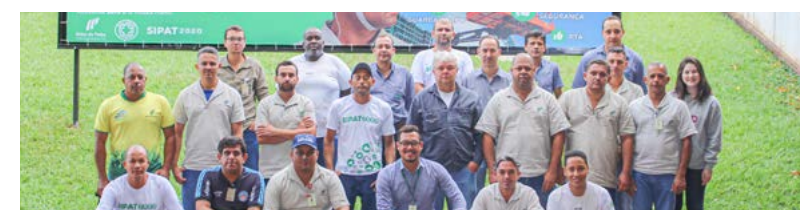
Membros da CIPA / CIPATR, da Usina Ipê, Usina Buriti e Usina da Pedra, respectivamente