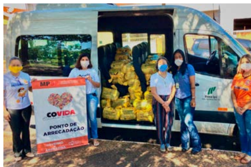
Doação de cestas básicas em Andradina/SP, realizada pela Usina Ipê