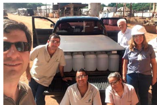
Doação de álcool 70% para prefeituras e instituições de saúde