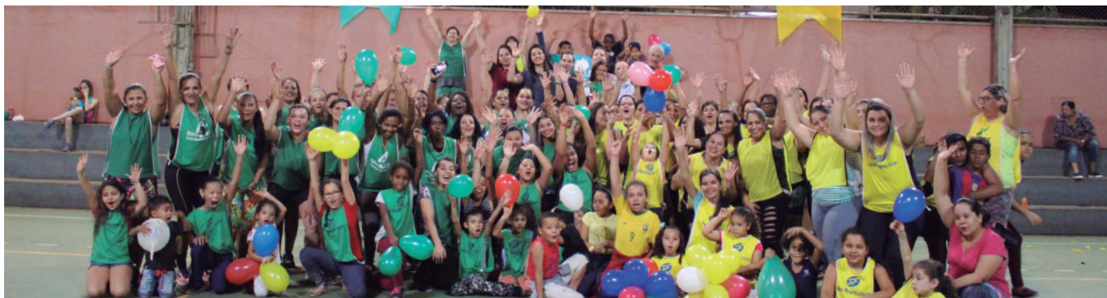
Participantes do FEVA 2019 realizado no Departamento de Promoção Social (DPS), em Serrana/SP