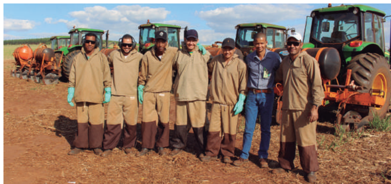
Representantes da equipe de corte da soqueira, da Usina da Pedra

Hoje o corte de soqueira acontece em 100% das áreas de cana soca das unidades Buriti e Pedra. Na unidade Ipê, essa operação iniciou recentemente e em áreas pontuais do canavial. Ao todo 48 funcionários estão envolvidos no processo, confira ao lado as equipes responsáveis pelo corte de soqueira.🌱