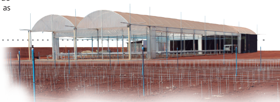
Obra do viveiro de Mudas Pré-Brotadas, na Usina da Pedra

Inicialmente o viveiro de mudas está projetado para produzir 5 milhões de mudas/ano com perspectiva de chegar a 20 milhões/ano. No local, serão produzidas as variedades promissoras e as que precisam ser reintroduzidas com problemas fitossanitários, ressaltando que haverá a possibilidade de seleção da variedade conforme a necessidade das áreas.🌱