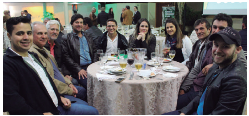
Fornecedores durante o jantar, na Usina da Pedra

O aumento do uso de biocombustíveis capazes de reduzir as emissões de poluentes e a redução dos combustíveis de petróleo são o ponto central do programa para a queda nos níveis de poluentes veiculares e diminuição do efeito estufa. Além disso, com o RenovaBio, a cadeia sucroenergética também ganhará um novo produto: créditos de descarbonização (CBios), que serão conferidos às produtoras de biocombustíveis e que poderão ser comercializados, ou seja, vendidos a quem precise compensar as emissões de carbono.■