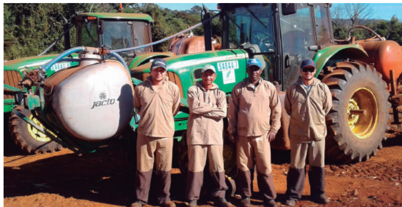
Representantes da equipe de corte da soqueira, da Usina Buriti