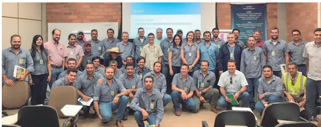
Funcionários, da Usina Ipê