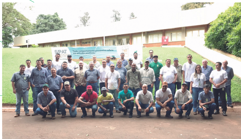
CIPA e CIPATR, da Usina da Pedra

Procure o setor de Segurança do Trabalho de sua unidade!