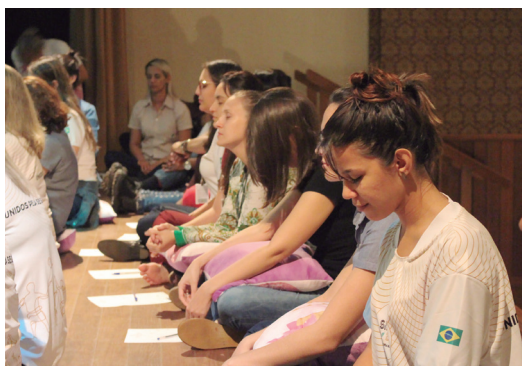
Momento de reflexão, na Usina da Pedra