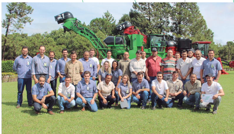
CIPA e CIPATR, da Usina Buriti