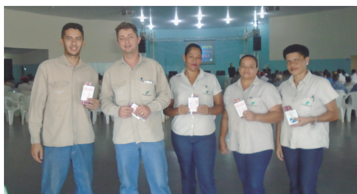
Funcionários, da Usina Ipê, durante a distribuição de preservativos e orientações sobre ISTs