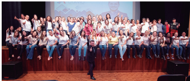
Mulheres, da Usina da Pedra