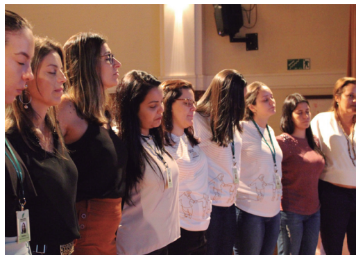
Controle da ansiedade durante relaxamento na Usina da Pedra