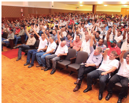
Compromisso com a meta Acidentes Zero assumido durante a SIPAT