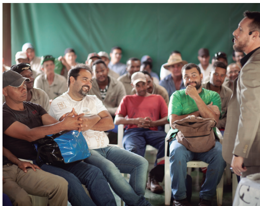
Funcionários, da Usina Buriti, durante a palestra da SIPAT