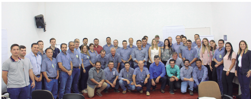
Funcionários, da Usina da Pedra