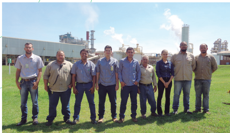
Representantes da CIPA e CIPATR, da Usina Ipê