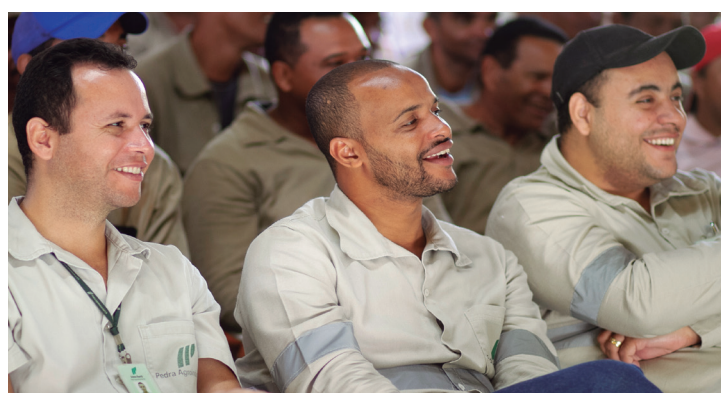
Funcionários, da Usina Buriti, participam das intervenções

Siga as dicas compartilhadas durante a SIPAT e mantenha a Segurança sempre em primeiro lugar: