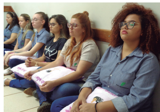
Mulheres, da Usina Buriti, durante relaxamento