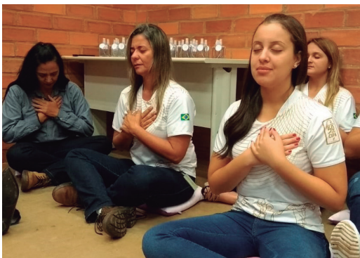
Meditação, na Usina Ipê