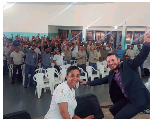
Equipes da Usina Ipê durante a última intervenção da SIPAT