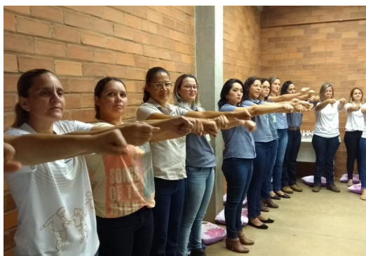
Dinâmica, na Usina Ipê