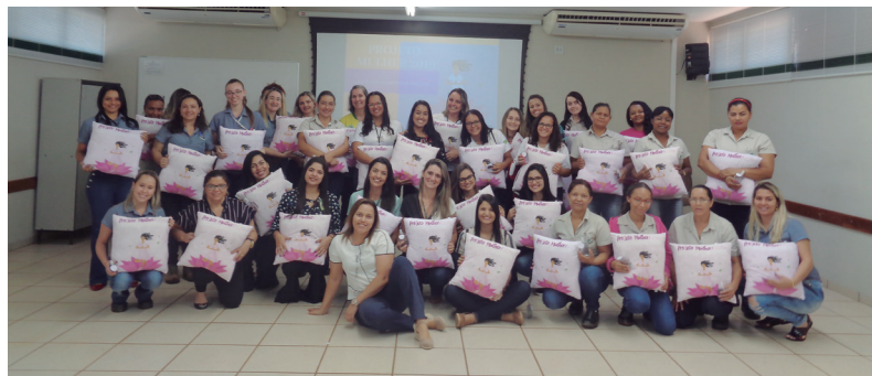
Mulheres, da Usina Buriti