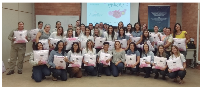
Mulheres, da Usina Ipê